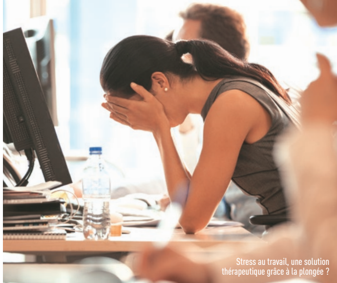
Stress au travail, une solution thérapeutique grâce à la plongée ?