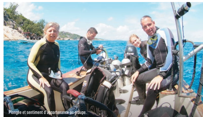
Plongée et sentiment d'appartenance au groupe.

"Mécanismes de récupération du stress au travail, développement et transfert de compétences par la pratique d'une activité physique de loisir: le cas des activités subaquatiques." Les résultats ont été réalisés auprès de 483 pratiquants réguliers de la plongée et avec des entretiens détaillés semi-directifs auprès de 46 personnes (réalisation en 2022 de ce pool de pratiquants-répondants grâce à la FFESSM dans un corpus final de près de 300 pages). Ils montrent ainsi, au-delà des bienfaits sur la santé mentale en particulier sur la réduction du stress au travail, comment la pratique régulière de la plongée (bouteille et apnée) est un potentiel de développement de ressources et d'acquisition de compétences transférables de notre activité de loisir vers le milieu professionnel. La réponse se trouve dans notre environnement spécifique avec ce milieu à contraintes particulières que nous connaissons.