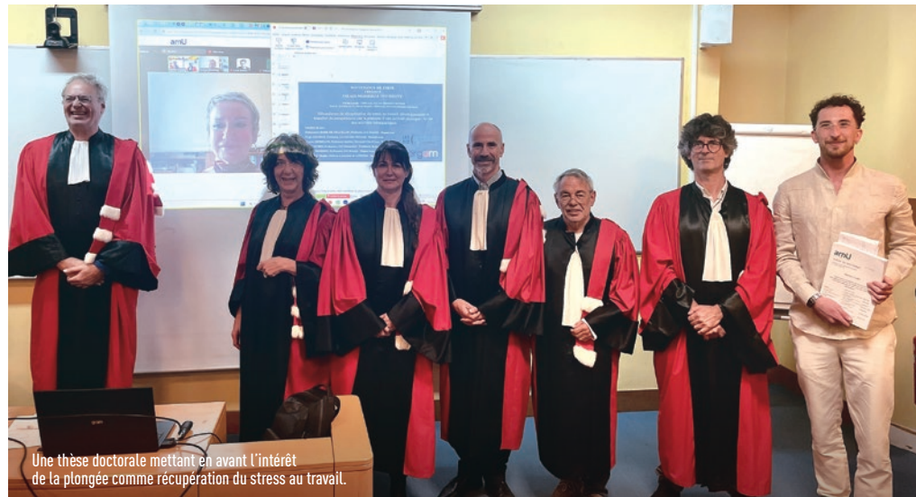
Une thèse doctorale mettant en avant l'intérêt de la plongée comme récupération du stress au travail.