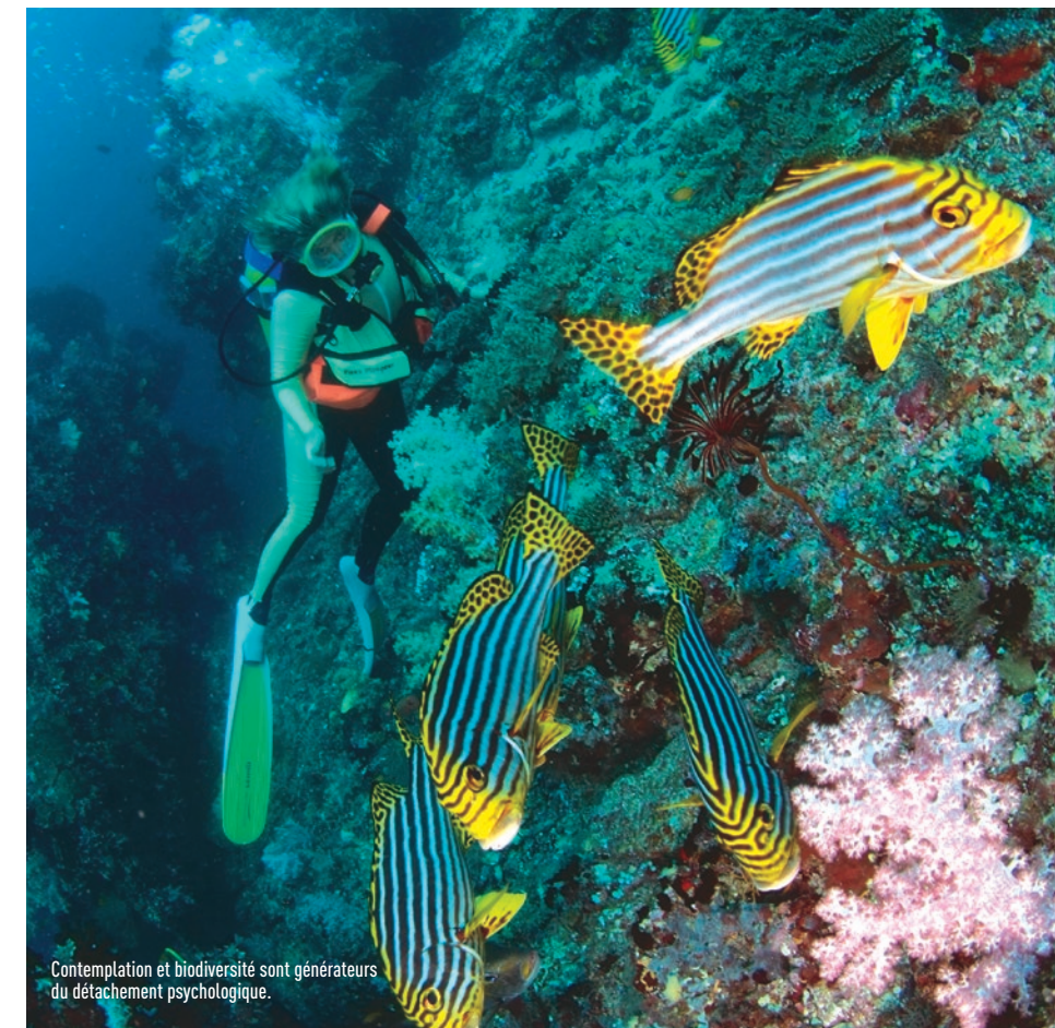
Contemplation et biodiversité sont générateurs du détachement psychologique.

Les quatre dimensions de récupération sont: > le détachement psychologique avec la mise à distance mentale du travail, > la relaxation avec la pleine conscience et la pleine nature, > le sentiment de maîtrise avec un apprentissage de gestes sans rapport avec la sphère professionnelle, > l'expérience de contrôle, choix de l'individu davantage en APS récréative que de compétition. Ce modèle connu de Sonnentag montre que le détachement psychologique joue un rôle crucial et central dans le processus de la récupération au stress en psychologie sociale du travail, suivi ensuite de l'effet modérateur de la dimension relaxation apportée par l'activité de loisir. Plusieurs travaux montrent que l'APS pratiquée durant les périodes de loisir augmente la vigueur et la performance mentale les jours d'après. En 2017, l'expérience française Dive Stress (Beneton et al.) mettait en lumière la rémanence au-delà d'un mois de la réduction du stress des pratiquants d'un stage de plongée à l'UCPA, comparativement à d'autres cohortes pratiquantes d'autres activités de pleine