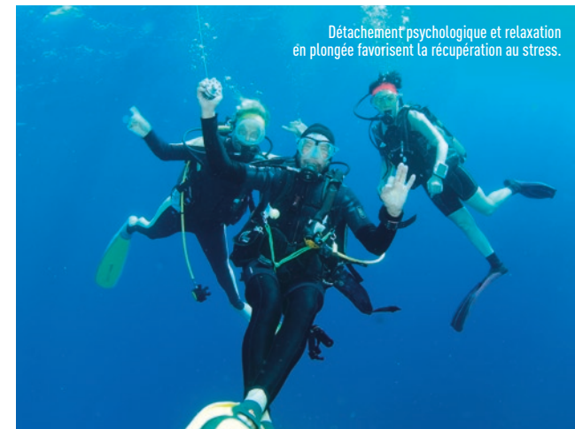
Détachement psychologique et relaxation en plongée favorisent la récupération au stress.

burn-out professionnel rapportent que la plongée les a menés à ressentir un détachement qui leur a permis d'atténuer le burn-out: "Le seul moment où j'arrivais à me sortir de mon état second, c'était quand j'étais sous l'eau et l'après-plongée." Certains utilisent spontanément le mot de méditation favorisée par la cohérence respiratoire, l'apesanteur, les modifications sensorielles et le contact étroit contemplatif avec la biodiversité. D'autres apportent leur vécu en termes de plus-value familiale: "Mes enfants me disent, c'est bien maman quand tu as plongé on peut te demander tout ce qu'on veut!" La dimension de sentiment de maîtrise est aussi abordée par de nombreux répondants, la maîtrise acquise par l'apprentissage permet de gagner des ressources comme la confiance en soi qui est bien utile pour contrebalancer le stress au travail. Enfin, le rôle du groupe (palanquée, binôme) est un élément aussi primordial évoqué dans les réponses, l'autonomie se conçoit au sein d'un groupe. La première règle de sécurité n'est-elle pas "Ne jamais plonger seul".