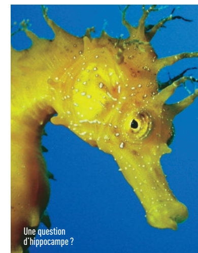
Une question d'hippocampe ?