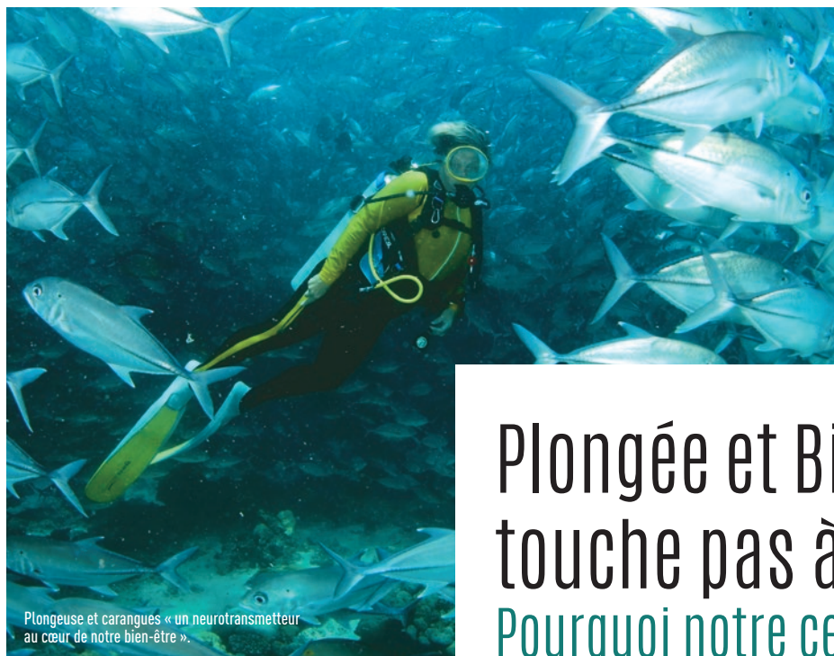
Plongeuse et carangues « un neurotransmetteur au cœur de notre bien-être ».