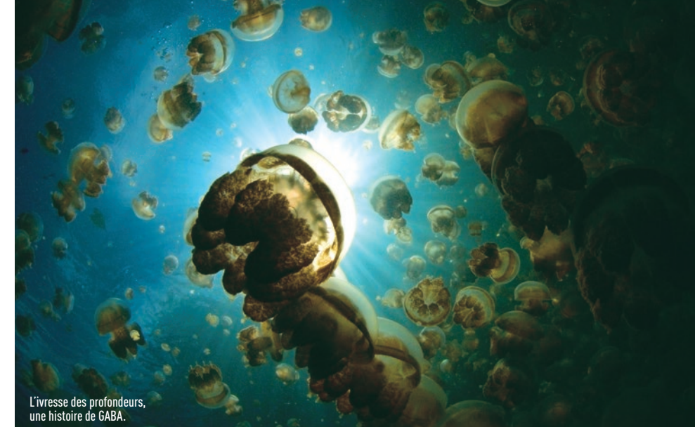
L'ivresse des profondeurs, une histoire de GABA.

dans un environnement favorisant la pratique d'activités physiques et culturelles est associé à la production de nouvelles cellules nerveuses. L'activité physique et sportive régulière augmenterait la taille de l'hippocampe même quand il est diminué par le vieillissement de l'âge. Marcher, nager, plonger sont donc bons pour notre cerveau.