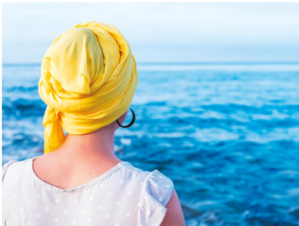
La résilience, terme qui en psychologie traduit la capacité à surmonter les chocs traumatiques comme le diagnostic d'un cancer.

Aujourd'hui, grâce à des diagnostics plus précoces et des traitements plus efficaces, plus d'un patient sur deux guérit du cancer. Cependant, le traumatisme du diagnostic de la maladie cancéreuse et les effets des traitements entraînent souvent des répercussions sur les plans émotionnel, physique, psychique et social qui persistent après la fin de la prise en charge thérapeutique. Le proche du patient est un acteur majeur dans ce parcours et subit, lui aussi, ces désordres psychiques et émotionnels.