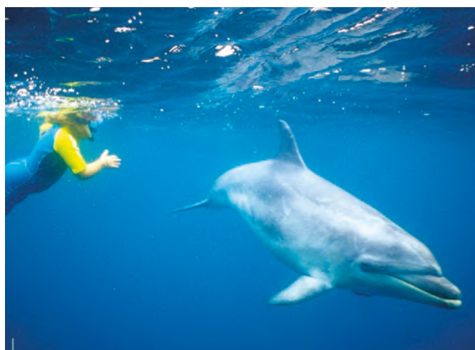
Le dauphin... une des rencontres « bonheur » préférées des plongeurs.