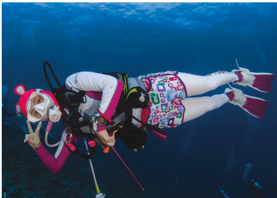
Relaxée cette plongeuse ? Il semble bien !

La pratique de la plongée subaquatique peut générer des angoisses dont les causes sont multiples : appréhension, froid, perte des repères terrestres, déshydratation, etc. Pour certains plongeurs, le stress ressenti entraînera une diminution des capacités d'attention, une altération du traitement de l'information, une distraction par des pensées parasites, des préoccupations, ou encore des difficultés concernant la prise de décisions. Ce stress est aussi à l'origine de problèmes de coordination motrice, de mauvais timings, d'impulsivité ou de fatigue extrême. Enfin, il peut contribuer aux blessures dues à une tension musculaire excessive ou à un manque de concentration. Face à une telle problématique, la mise en œuvre de techniques simples visant à mieux gérer son anxiété avant de s'immerger s'avérera très bénéfique.