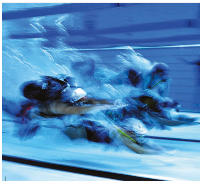
Émulation, activité en équipe... la PSP : vecteur de socialisation.

moyen pertinent de se valoriser, de s'évaluer par rapport aux autres avec une notion d'entraide et de solidarité. Chez les jeunes, il permet de construire son autonomie dans l'action collective. Car la plongée scaphandre établit une relation de confiance avec sa palanquée et surtout avec son binôme de plongée. En plongée libre, c'est avec son compagnon que s'installe cette relation de confiance sécuritaire, chacun en alternance surveillant l'autre de la surface pendant son immersion. Ainsi, nous veillons pendant l'activité, les uns aux autres (et sur nous-même) et activité de partage pendant la plongée et après.