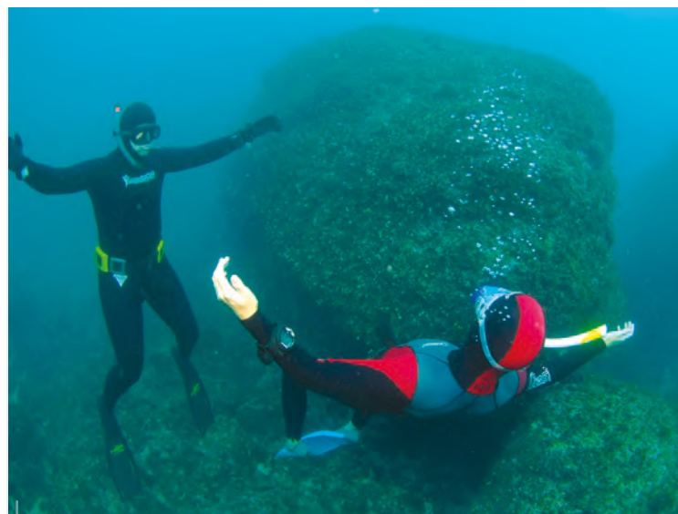
Apnée et relaxation vont de pair...