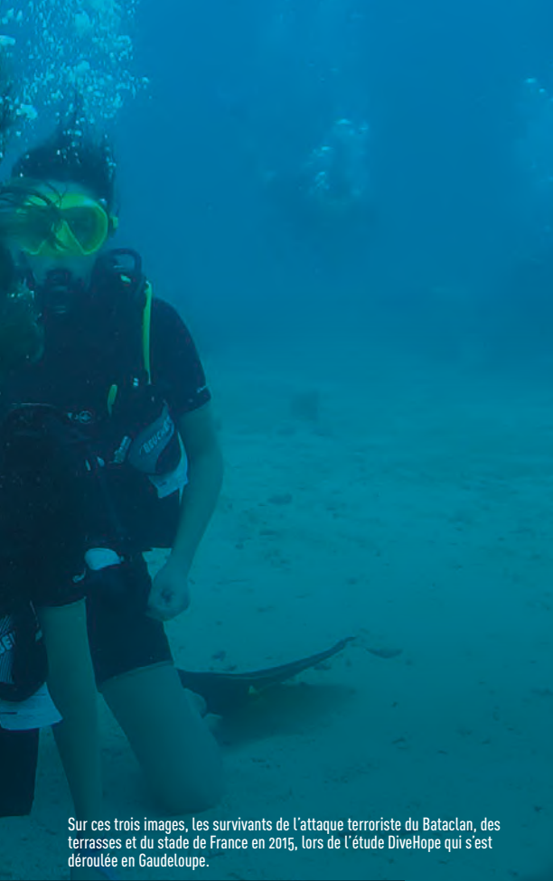
Sur ces trois images, les survivants de l'attaque terroriste du Bataclan, des terrasses et du stade de France en 2015, lors de l'étude DiveHope qui s'est déroulée en Guadeloupe.