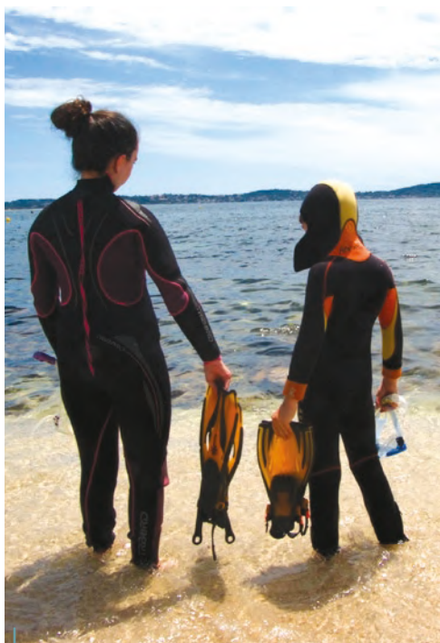
La randonnée subaquatique partagée en famille, source de bien-être.