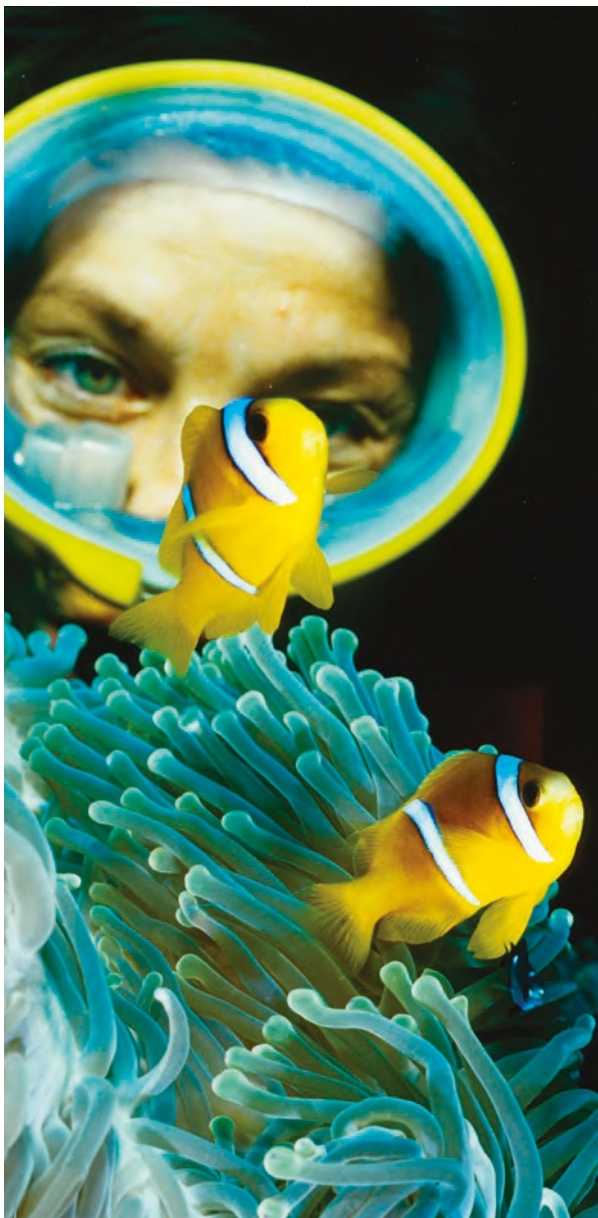
La plongée, un bienfait anti burn-out.