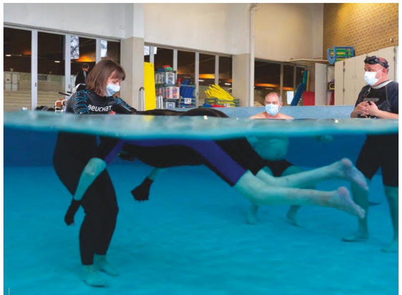
Pour le public en situation de handicap, l'immersion source de bien-être et de qualité de vie.